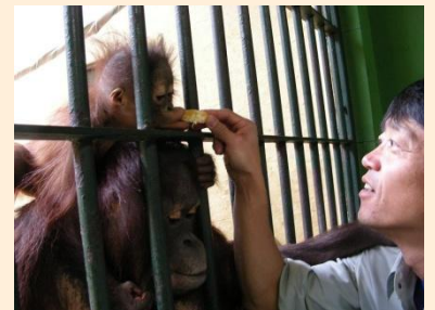
チンパンジーのレディの飼育

開園60周年を迎える今年は記念イベントも多数あり、その企画にも積極的に関わっているところです。今後の予定としては、「円山動物園環境教育に関するワークブック」づくりの検討にも参加していきたいと思っています。動物園側の協力も頂き「電子黒板の教材化」づくりも少しずつ進んでいます。