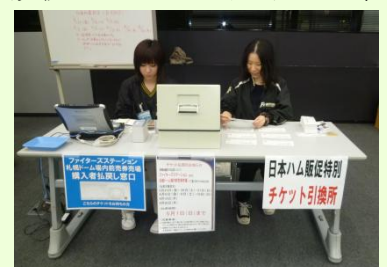
チケット業務の様子

6月からは商品開発、販売、管理を行う部署でグッズに関わる業務に就きます。気持ちを新たに、また様々なことを学んでいきたいです。