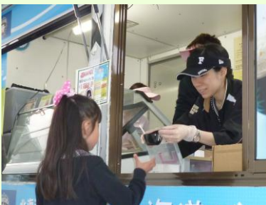
ジェラート販売の業務

6、7月は、関連グッズの開発、販売、管理を行うマーチャン・ダイジンググループで研修をしました。この2か月で学んだことは「チームワーク」と「笑顔」の大切さです。ジェラート販売の業務では、社員、アルバイトにかかわらず、一人一人が問題意識をもち、その都度、意見を交換し改善を繰り返しました。また、忙しさのあまり笑顔であることを忘れがちになります。お客様に気持ちよく御購入していただくために、自分たちが前向きな気持ちで仕事をするためにも、「笑顔」を大切にしています。