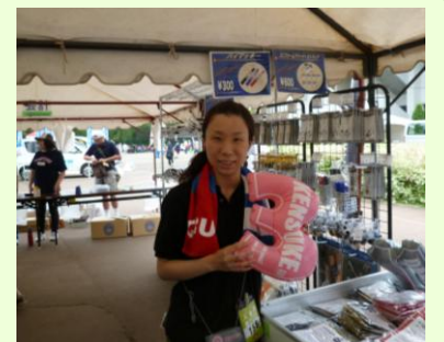
帯広でのグッズ販売の様子

先日、帯広の試合に同行する機会があり、地方のファンの方々のファイターズへの熱い思いを肌で感じる事ができました。8月からはファンクラブグループで研修しています。研修がより有意義なものになるよう、さまざまなことを吸収していきたいです。