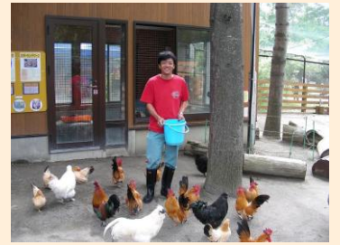
ドキドキ体験メニューの様子

ニワトリなどの動物たちが、食事をする所をガイド付きで見たりすることができる「ドキドキ体験メニュー」を実施しています。私は、『モルモットのふれあい体験』を含め4つのガイドを行っており、その際に心掛けているのは、班の合言葉である「おもてなしの心日本一」です。今後も、飼育員の立場からの視線とともに市民の視線で考え、お客様に満足していただけるよう「ドキドキ体験メニュー」の充実の仕方や、「おもてなしの心」の在り方を研修したいと思います。