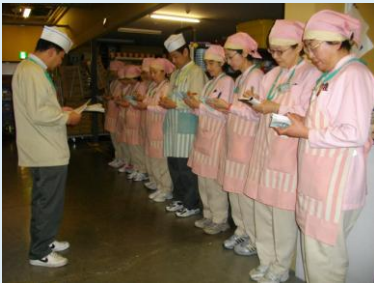
ミーティングの様子

生活雑貨やキッチン家電などを扱う「ハウスキーピング部門」での研修が6月に終わり、7月からは「デイリー部門」に異動することになりました。売場が変わっただけでも、自分にとっては大きな変化でした。特に、食品を扱うということで、今まで以上に衛生面に気を付けなければなりません。また