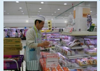
商品の陳列品出し業務

一つ一つ商品には販売期限があり、常に気にしながら陳列・品出しすることも大切になってきます。扱う商品の数や種類も多く、パンやデザート、飲料などの洋風デイリーの他、豆腐や練り物、麺類、お漬物などの和風デイリー、さらには、冷凍食品やアイスクリームなどもあります。陳列や品出し業務の速さに目が回りそうなきもありますが、忙しい分、一層の充実感や満足感を感じています。