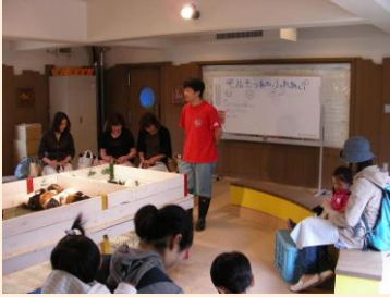
モルモットのふれあい体験

夏休みが始まり、円山動物園には日中でも多くの家族連れの姿が見られるようになりました。私が所属している「こども動物園」（ふれあい班）は、園内で唯一動物に直接触れ合える場所です。現在は、「モルモットのふれあい体験」を行っています。また、トビのフリーフライトを間近で見たり、ウサギや