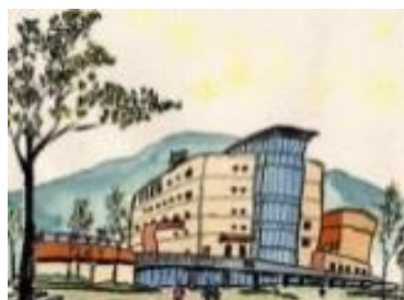
〈宮の沢・教育相談室〉

※平成28年4月22日(金)より開始 [ 相談時間 10:00~15:00 まで ]