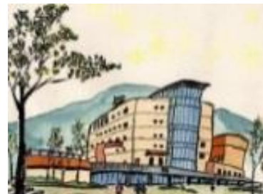
〈宮の沢・教育相談室〉

※指導主事+教育研究員(児童生徒の教育相談実務経験者及び4年制大学卒で児童・発達・教育等心理学を修了している者)のペアによる相談体制